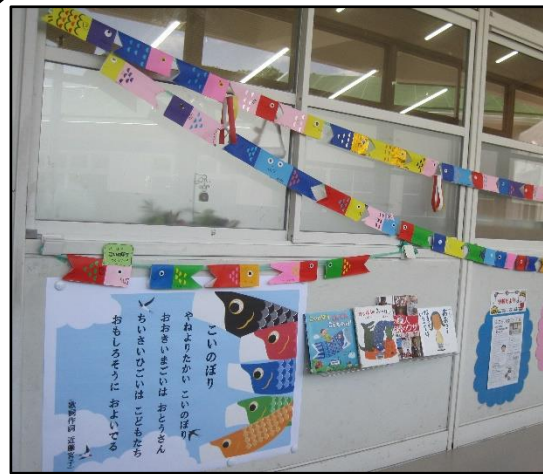
図書室前のろうかです。カラフルな“こいのぼり”は、図書委員さんや図書室に来たみなさんと一緒に作りました!

今月は、こいのぼりをテーマにした本と、5月3日・憲法記念日に併せて、憲法について学べる本を掲示しています。読書や自学の本選びの参考にしてください。